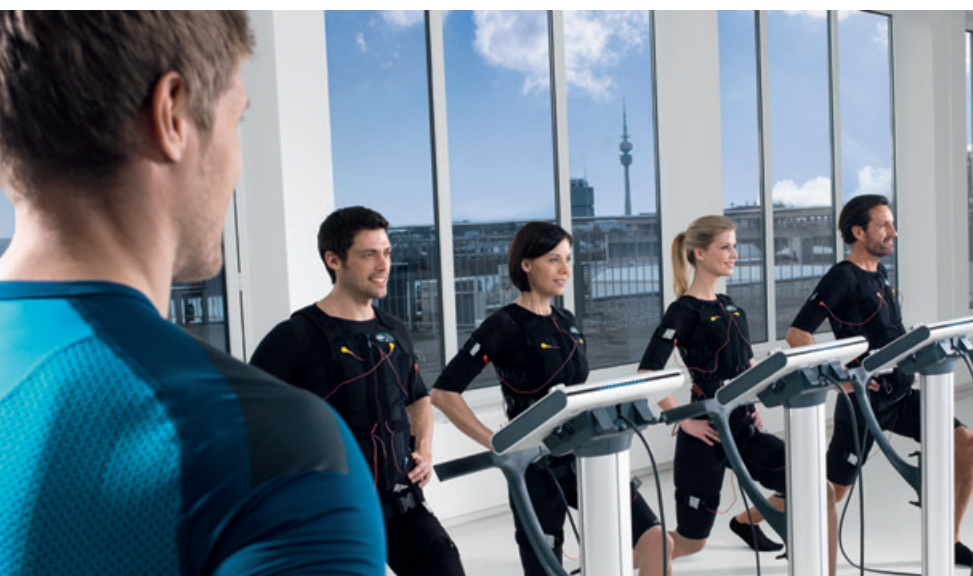
Das Training mit dem miha bodytec garantiert höchste Effektivität, sicht- und messbare Ergebnisse sowie begeisterte Kunden

Bereits über 2.000 gewerbliche Anbieter in Deutschland und Österreich nutzen das Potential von miha bodytec. Als Marktführer hat das Unternehmen den Markt an den Punkt entwickelt, wo er heute steht. Und genau das macht miha bodytec aus.